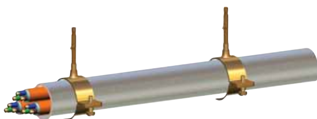
Verlegeabstand: ≤ 1.200 mm