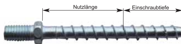
MMS-St 7,5x80 (120,140,160)

Anwendung: Zur Befestigung auf bewehrtem und unbewehrtem Normalbeton der Festigkeitsklasse von B25 bis B55 nach DIN 1045 "Beton und Stahlbeton", sowie auf Kalksandstein- und Vollziegelmauerwerk der Festigkeitsklasse \geq 1,2 .