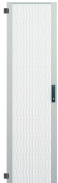
Perforation Typ C Luftdurchlässigkeit 80 %