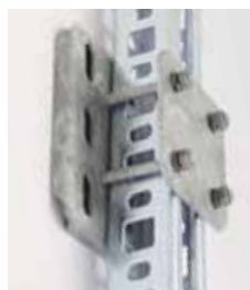
Montageplatte für 1 Profil 50x50