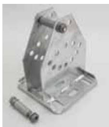
Kopfplatte 4-loch winkelverstellbar