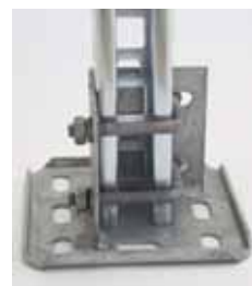
Kopfplatte schwer mit Bügelschraube